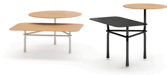
Table d'appoint unique pour les espaces décontractés affichant une touche de modernité.

La conception et les détails soignés des deux modèles peuvent être associés pour créer une ambiance intéressante et en font une table extrêmement flexible pour la maison ou les espaces commerciaux.