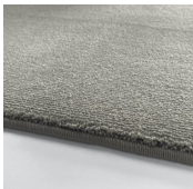
Amazing Grey Tea Rose