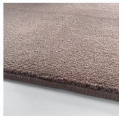
Tea Rose Amazing Grey