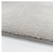
Simply White Simply White