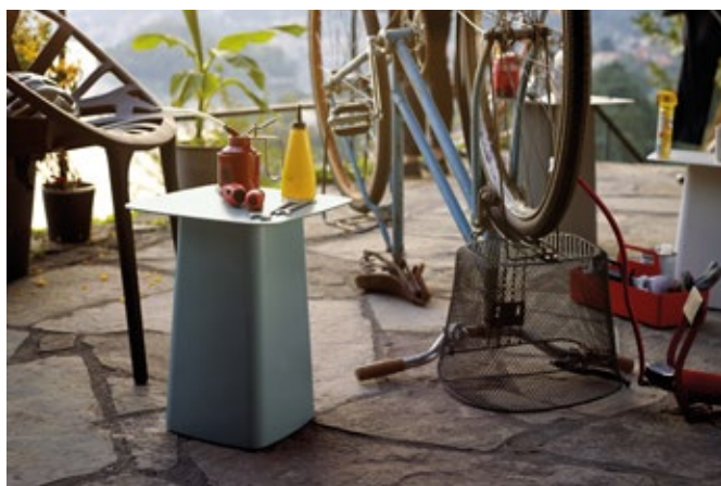
Metal Side Table (Outdoor)

Les Metal Side Tables sont disponibles dans une version résistant aux intempéries, à la finition époxy finement structurée. Les tables sont le complément idéal pour le fauteuil Waver qui se prête à une utilisation à l'intérieur et à l'extérieur, dont les piètements sont disponibles dans des couleurs assorties.