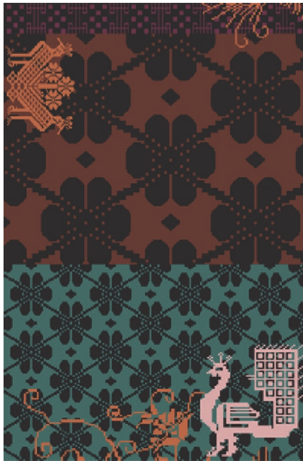
312 - Peacock dark colors