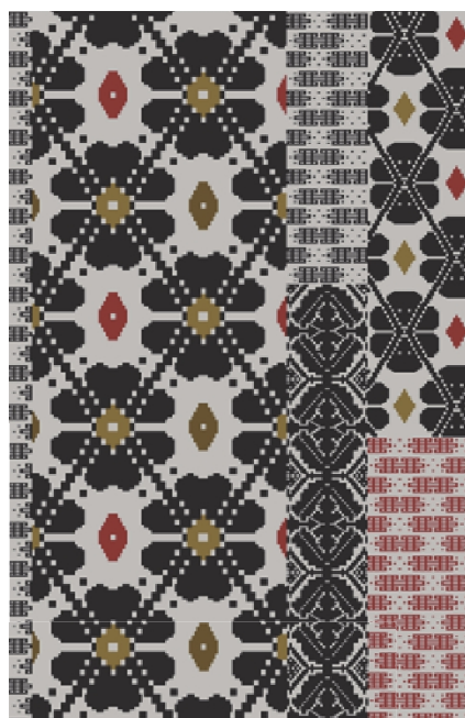
310 - Flowers dark colors