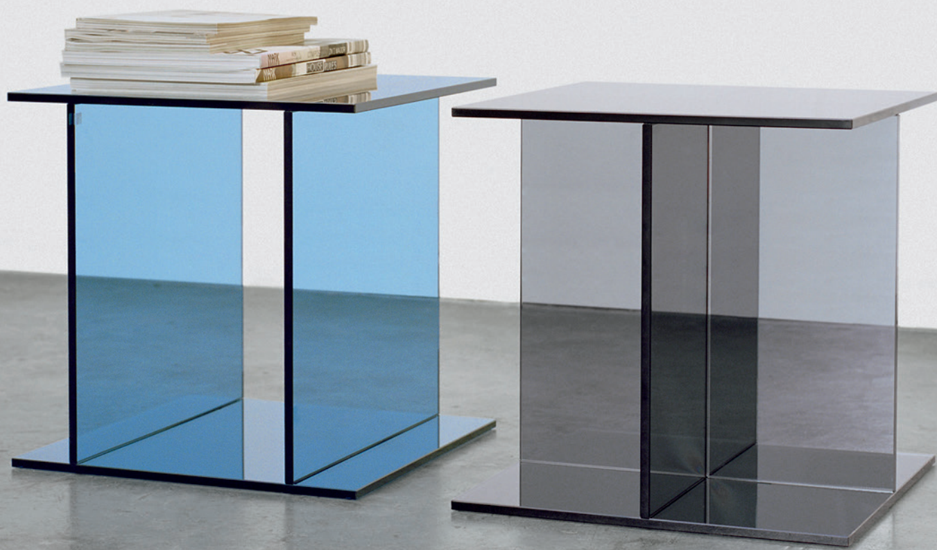
CT07 DREI BEISTELLTISCH / SIDE TABLE GLAS, DUNKELBLAU / GLASS, DARK BLUE CT08 VIER BEISTELLTISCH / SIDE TABLE