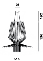
SCHÉMA ET ÉMISSION DE LUMIÈRE