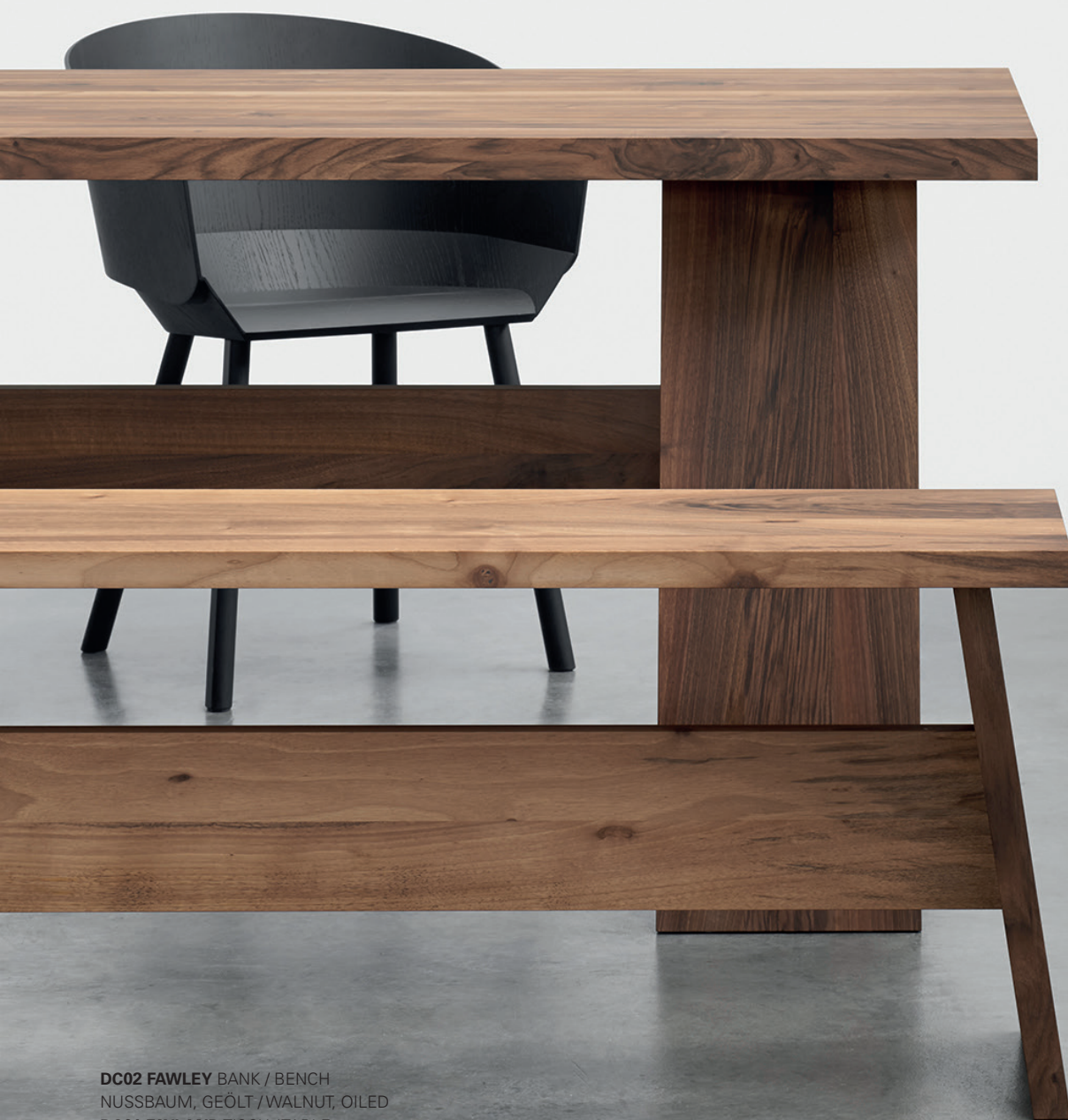
DC02 FAWLEY BANK / BENCH NUSSBAUM, GEÖLT / WALNUT, OILED DC01 FAYLAND TISCH / TABLE CH04 HOUDINI STUHL MIT ARMLEHNE / CHAIR WITH ARMREST