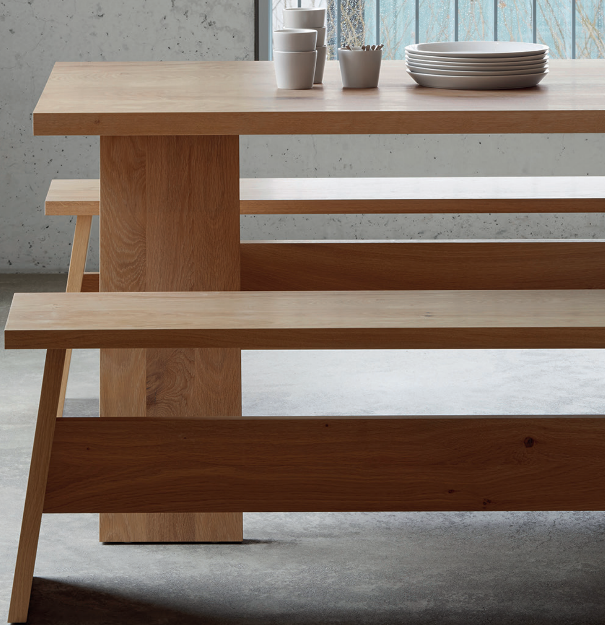
DC02 FAWLEY BANK / BENCH EICHE, WEISS PIGMENTIERT, GEWACHST / OAK, WHITE PIGMENTED, WAXED DC01 FAYLAND TISCH / TABLE