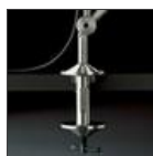
TOLOMEO MORSETTO A004100