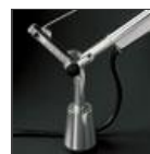
TOLOMEO SUPP.TAVOLO FISSO A004200