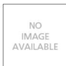
TIZIO NERA SUPPORTO TERRA A087700